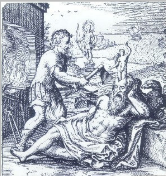
immagine tratta da "Astrology-Research.net"

http://www.astrology-research.net/researchlibrary/eureka/