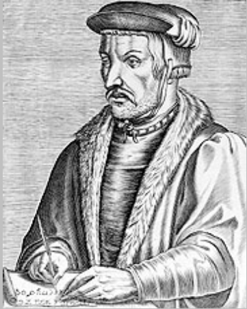
Enrico Cornelio Agrippa

Il numero 72 perciò “è degno di rimarco” dice Cornelio Agrippa[3] nel suo monumentale trattato “De occulta philosophia”, aggiungendo che :